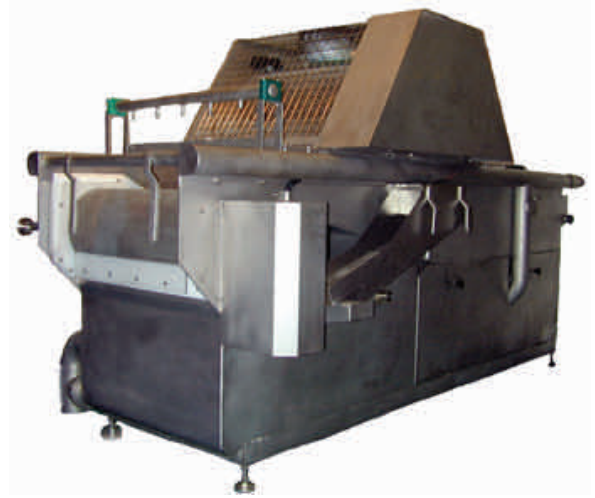
El Polywash™ está manufacturado bajo una licencia de Freeze Agro Ingenierie SARL de Francia. El Polywash™ está manufacturado bajo uno más de los siguientes patentes: FR9812412 & FR9407853. Polywash™ es una marca registrada de Freeze Agro Ingenierie SARL.

El tambor opcional se localiza estratégico para capturar y para eliminar partículas más pequeñas e insectos mientras que el producto se mueve desde la zona turbulenta a la zona tranquila. Esta característica es altamente eficaz en quitar partículas indeseadas del producto.